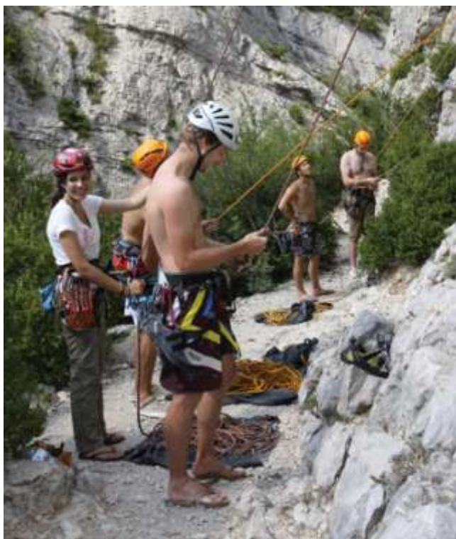
Ci-contre un groupe de grimpeurs au pied de la falaise du Belleric.

On comprend aisément en regardant la photo pourquoi les chutes de pierres ou de blocs peuvent avoir des conséquences dramatiques.