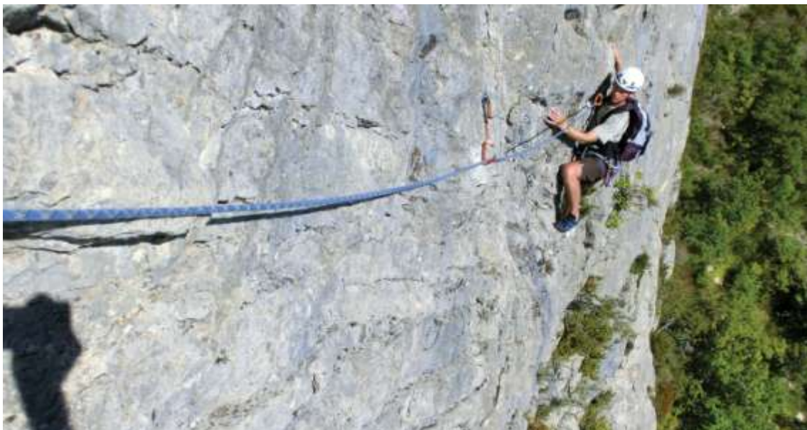
Ci-dessus : ambiance « grande voie » dans la falaise de l'Ascle