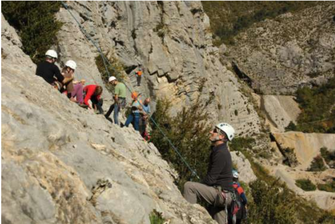
Ci-dessus : les racines du ciel, un secteur découverte dans la falaise du Château

Cette dynamique, largement relayée par les médias escalade, a sans aucun doute largement contribué à la réussite du site et à sa fréquentation.